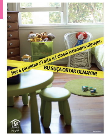
Ensest Yuvarlak Masa panelistlerinden Mor Çatı'nın yürüttüğü kampanyanın afişi